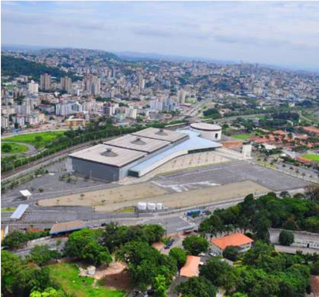
Bela Vista aérea do Expominas BH

O Expominas BH foi inaugurado inicialmente em 1998, tendo sua segunda inauguração em 2006. Concebido pelo arquiteto e urbanista, Gustavo Penna, foi pensado para ser múltiplo, atendendo todos os tipos e formatos de eventos.