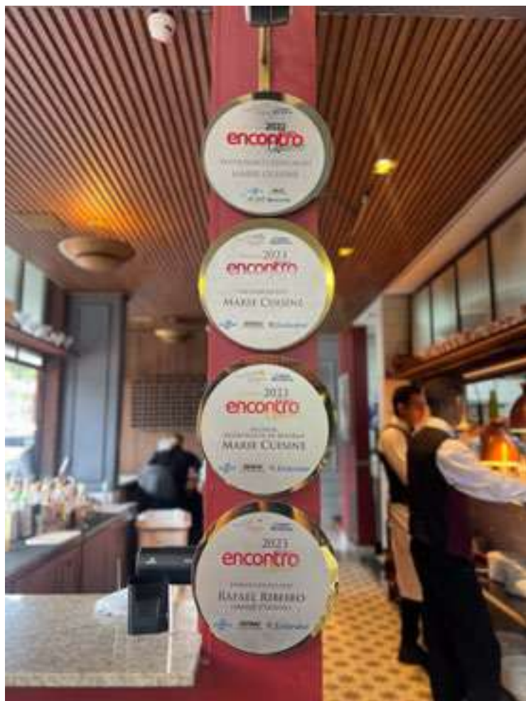
Em Belo Horizonte, cardápio muito apreciado pelos mineiros

Funciona de segunda a segunda, sempre para almoço e jantar, com exceção de domingo a noite. Em alguns dias da Semana toca Jazz ao vivo.