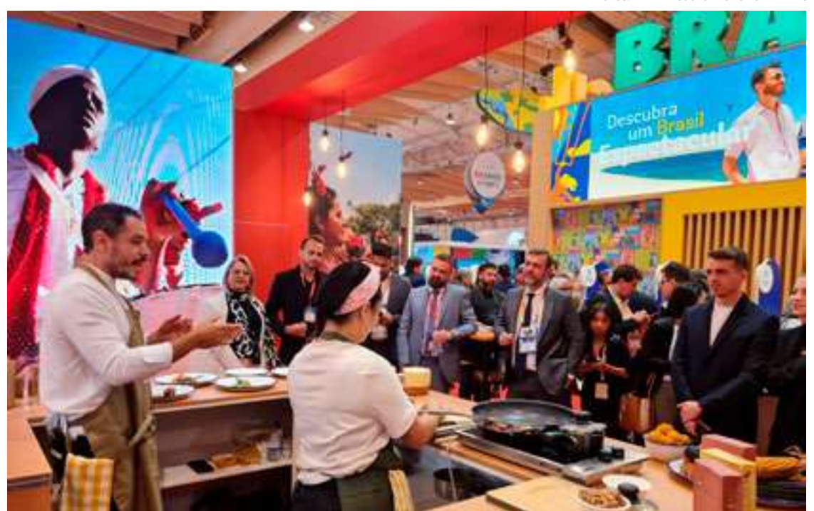
Estande Minas Gerais na BTL Lisboa

A programação da 34ª edição da Bolsa de Turismo