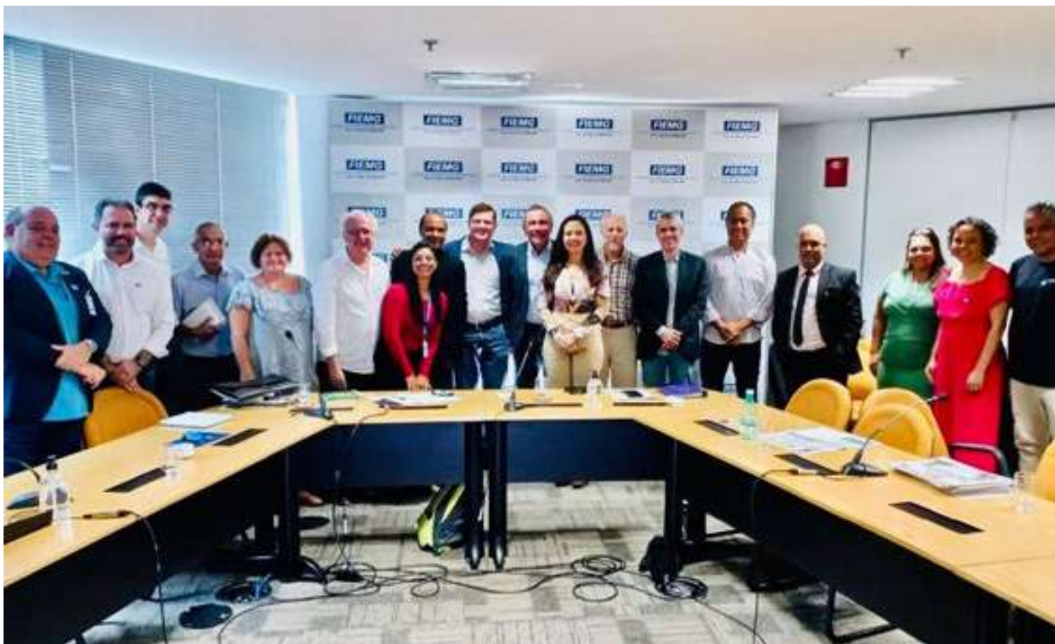
Associados do Sinejor/BH e Sindijori/MG presentes na sede da FIEMG

Aconteceu na Federação das Indústrias de Minas Gerais – FIEMG, a assembleia conjunta do Sindicato dos Proprietários de Jornais, Revistas e Veículo de Comunicação Digital de MG (Sindijori/MG) e o Sindicato das Empresas Proprietárias de Jornais e Revistas de BH (Sinejor/BH).