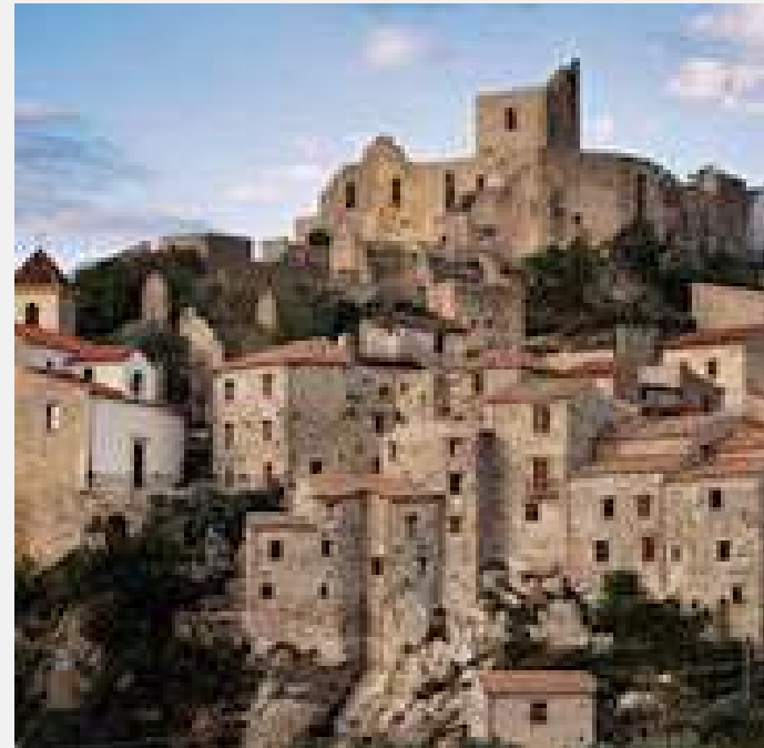
Albergo Diffuso na Village of Quaglietta

De tempos em tempos, uma nova tendência no turismo nasce e se espalha pelo mundo.