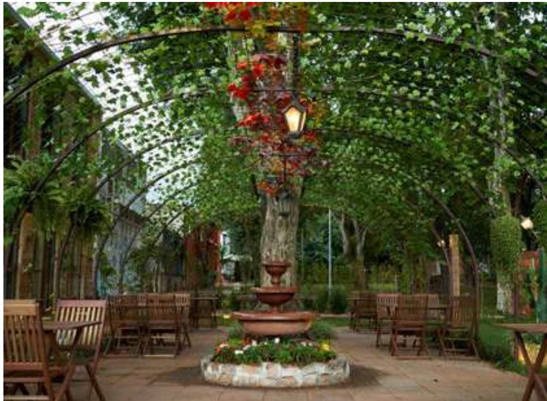
Em Brasília, vista geral do Restaurante Marie Cuisine

O Marie Cuisine é um franco-italiano localizado na 103 Sul, virado para o Eixinho. Em Belo Horizonte, ele está situado no terceiro piso do Shopping Diamond-Mall. Sua arquitetura é inspirada nos tradicionais bistrôs franceses, idealizada pelo StudioBrick . É a terceira casa do grupo Família Papà, que tem ainda o Papà Cucina, no Gilberto Salomão, e o Babbo Osteria, no Terraço Shopping, o Nonno Cantinetta, no Brasília Shopping e o Cozze Mediterrâneo, no Lago Sul.