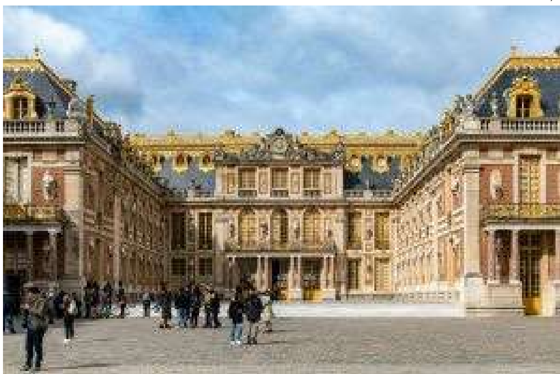
Bela Vista dos prédios históricos de Paris

Torre Eiffel: A Torre Eiffel é um ícone muito signifi-