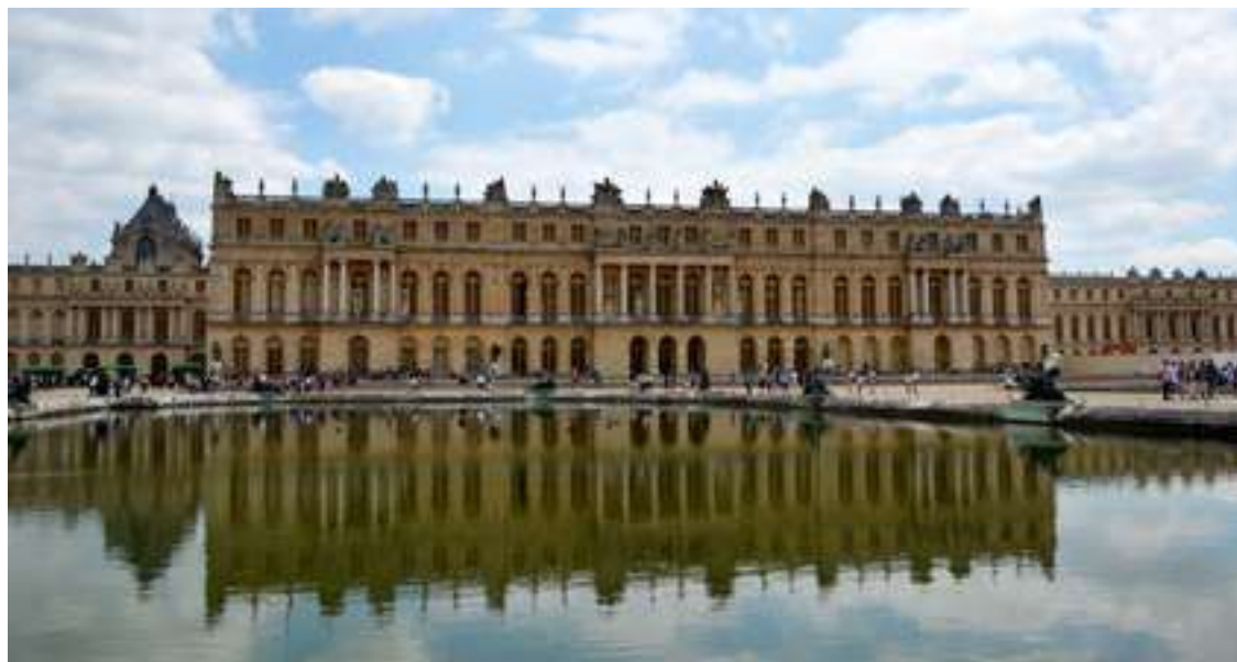
O Palácio de Versalhes

Jardins de Luxemburgo: Os Jardins de Luxemburgo são ótimos para caminhar e fazer um piquenique. Quem desejar pode fazer uma visita guiada no parque que possui uma série de atividades para todos os gostos e idades como museus, playgrounds e quadras esportivas.