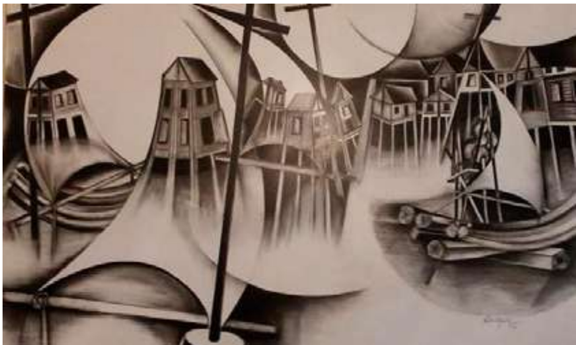
Sem dureza, total fluidez, navega o casario de Sílvia Gaia através do Tempo.