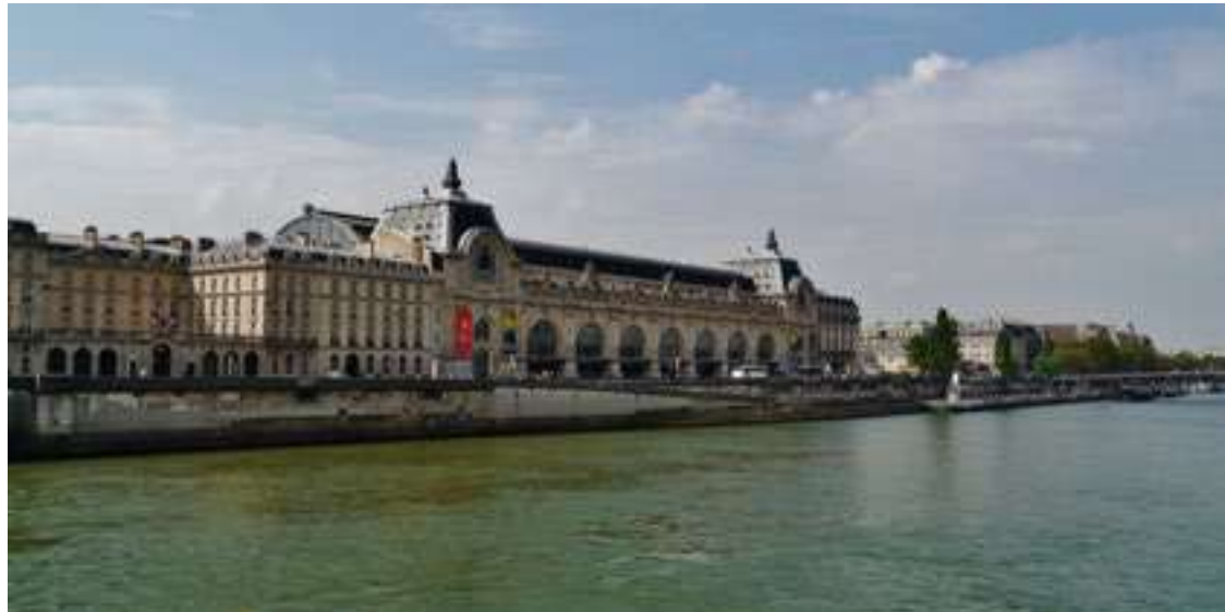
Museu d'Orsay que já foi uma estação de trem

Museu d'Orsay: Esse museu abriga pinturas, esculturas e arte ocidental do período compreendido entre 1848 e 1914. Os turistas podem ter uma verdadeira aula de história da arte e conhecer pintores como: Van Gogh, Monet, Renoir, Degas, Gauguin e muitos outros. Reserve algumas boas horas.