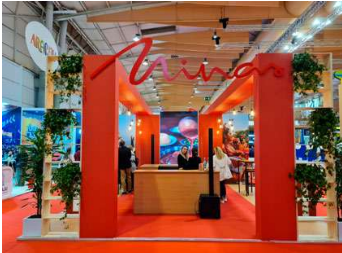
Nova visão do Estande de Minas Gerais

Minas Gerais conquistou os portugueses que participaram da 34ª edição da Bolsa de Turismo de Lisboa (BTL), realizada na última semana, entre quarta-feira (28/02) e domingo (03/03), mostrando aos participantes da feira suas riquezas, sua cultura e as delícias da cozinha mineira.