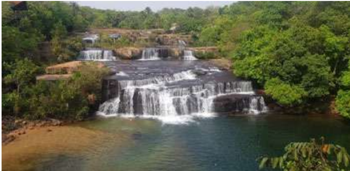
TVE MS Programa Expedição MS, da TV Educativa de Mato Grosso do Sul

Programas de emissoras da Rede Nacional de Comunicação Pública (RNCP) ganham mais espaço na grade da TV Brasil a partir de segunda-feira (4), quando o canal estreia sua nova programação. Gerida pela Empresa Brasil de Comunicação (EBC), a Rede é formada por emissoras de TV e rádio de todo país, propiciando cultura e informação para milhões de brasileiros.