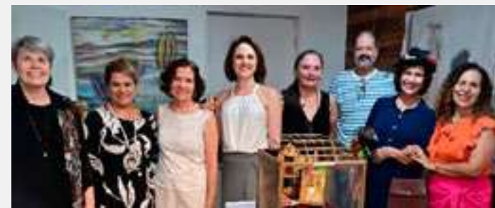
Grupo de artistas participantes da bem idealizada exposição "Névoas de Ouro Preto", em cartaz no Centro de Arte Popular.