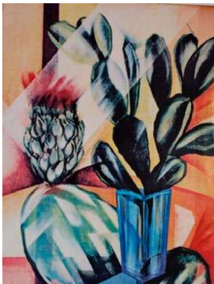
"Cactácea florindo" - espécie de Palma comestível pelo gado no Nordeste (gente também consome). Técnica de transparências, luzes e sombras, equilíbrio de cores em harmoniosa composição. Por Sílvia Gaia